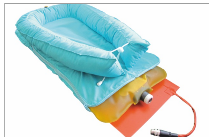
Система обогрева на водяном/гелевом матрасе (опция)