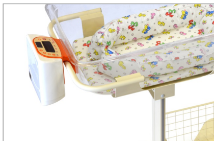
Блок управления системы обогрева (опция)

Безопасная рабочая нагрузка ..... 10 кг Масса кровати (без приспособлений), не более ..... 28 кг