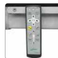
Пульт управления беспроводной