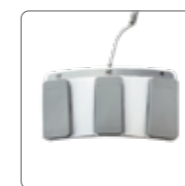
Пульт управления ножной